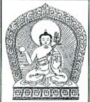
南無普相莊嚴瀝佛