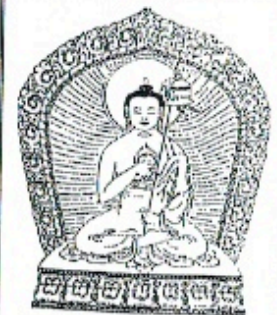
南無帝釋最勝幢佛