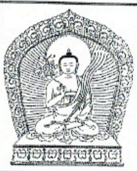
ལྷོ་གསལ་