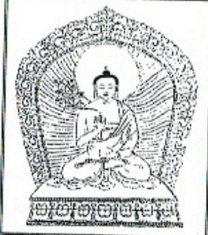
南無蓮華光遊戲神通佛

། དེ་དག་གི་སྤྱོད་སྤར་མཚོ་ལ་ཤོ་འཚགས་ཤོ། མི་འཚབ་ཤོ། མི་སྤོད་དོ། 帖他 克 格 以 間 黑 阿 黑 託 黑 洛 洽 克 梭 米洽 不 喔 米佩 多 彼等尊前發露懺悔。不覆、不藏