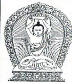
南無寶蓮華善住須彌山王佛